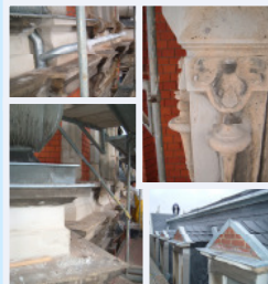
während der Bauphase