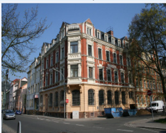
Haus der Demokratie