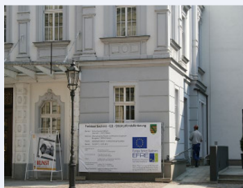
Während der Bauphase