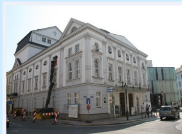
Theater mit 2007 übergebenen Anbau