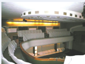
Theatersaal vor der Sanierung